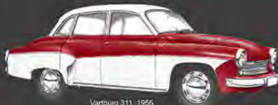
Volvo 311, 1956