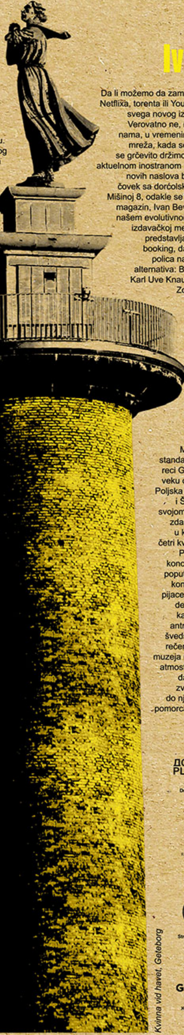
Kivina vid havet, Geteborg