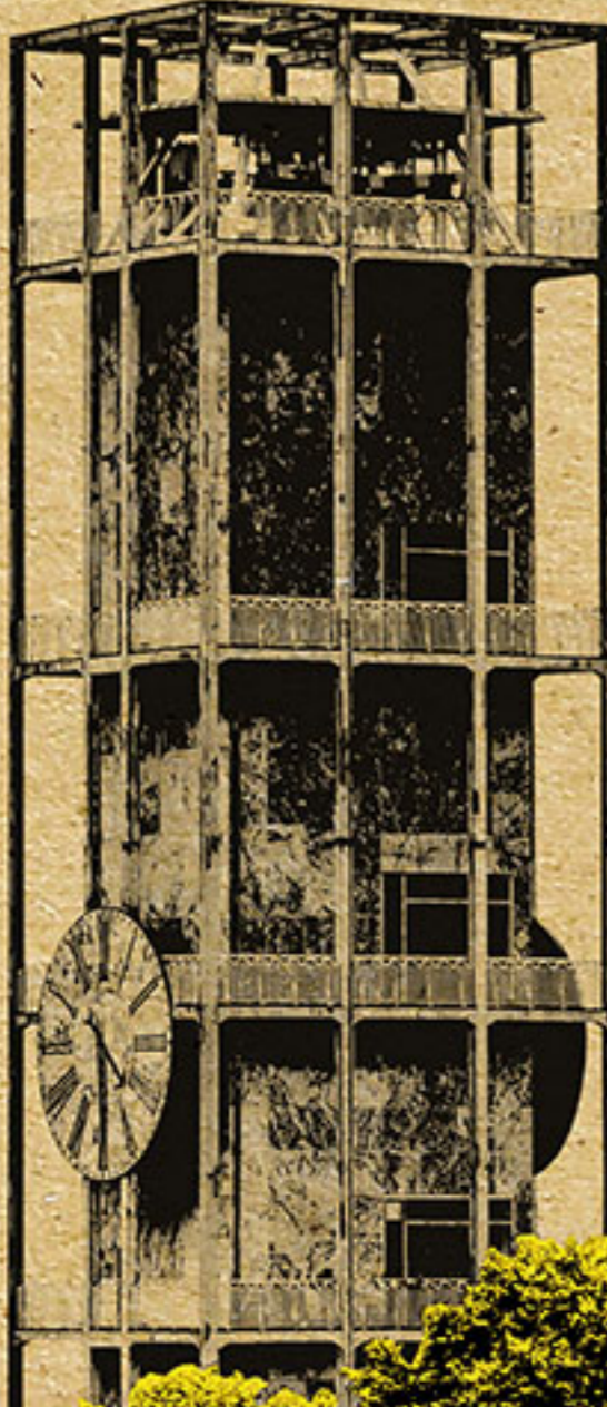
Tornjegradske kuće, Arhus